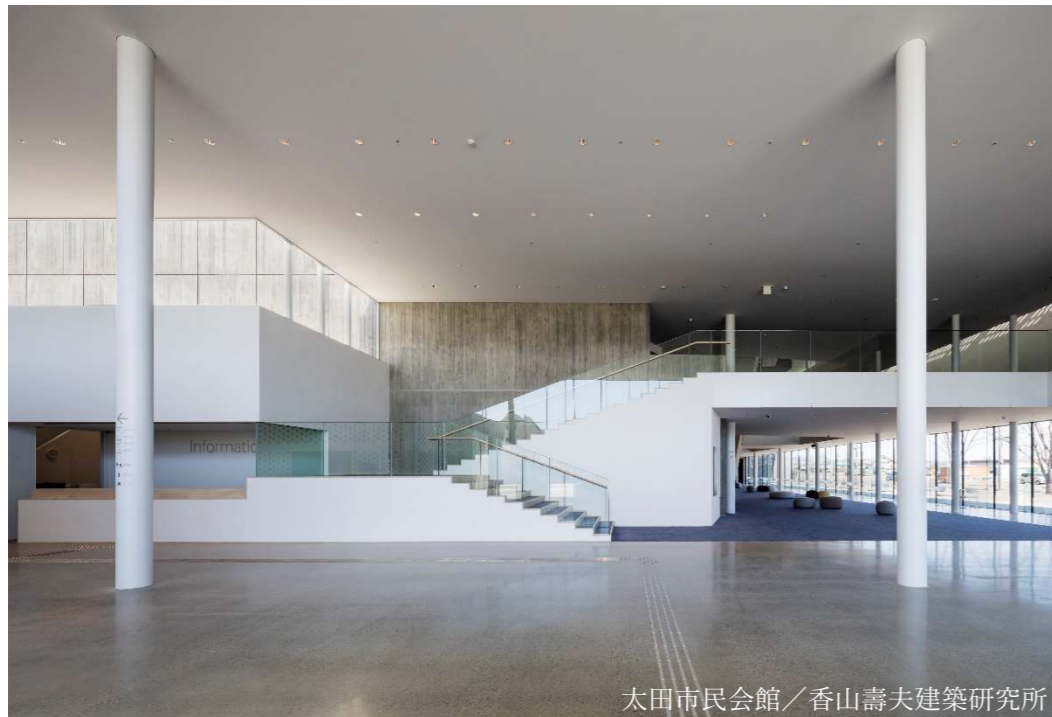
太田市民会館／香山壽夫建築研究所