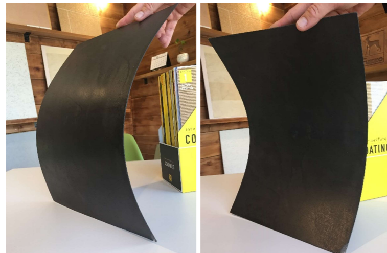
表面硬度は非常に高く、さらに弾性性能も併せ持っている https://www.youtube.com/watch?v=LfZ-yFV465I