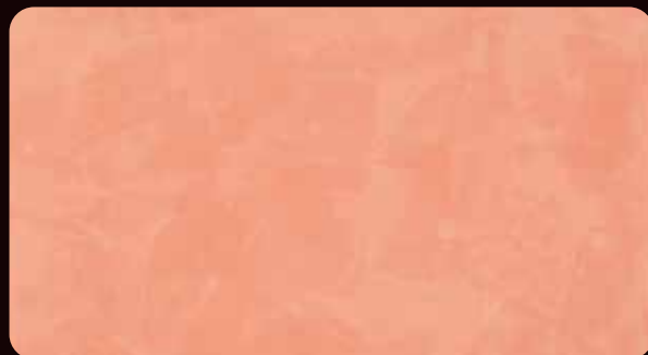
MARUMO STUCCO マルモ スタッコ (VMS-121)