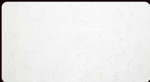
VIA STELLA ヴィア ステラ (VVS-100)

大理石粉が主成分のテクスチャー数種類を塗り重ね、微妙な陰影を作り出す艶をおさえたマット仕上。色の濃淡とあいまって壁面に落ち着きのある表情を与えます。