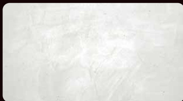
CARRARA カラーラ (VCA-100)

※スパチュラは責任施工となります。ご検討の際は弊社営業担当までお問い合わせください。