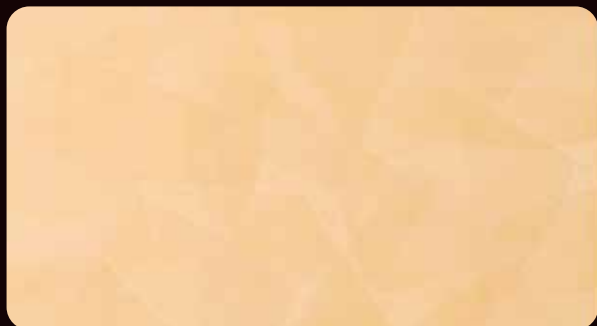
ANTIQUE STUCCO アンティーク スタッコ (VAS-105)

天然大理石の細かな粒子を配合した独自の天然着色土が、大理石そのものを思わせる滑らかで透明感のある輝きと、ヘラによるダイナミックなパターンを表現します。