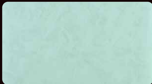
MARMO MAT マルモ マット (VMM-107)