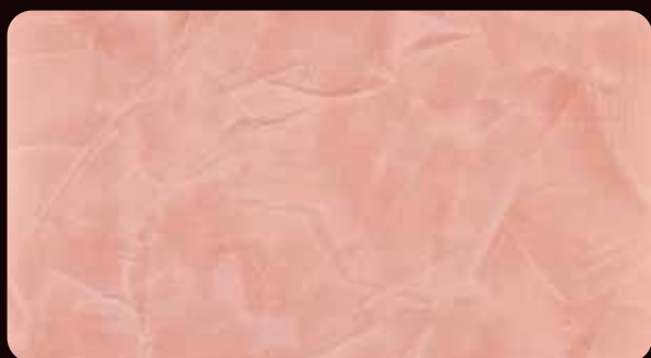
SPATULA スパチュラ (VSP-113)

※スパチュラは責任施工となります。ご検討の際は弊社営業担当までお問い合わせください。